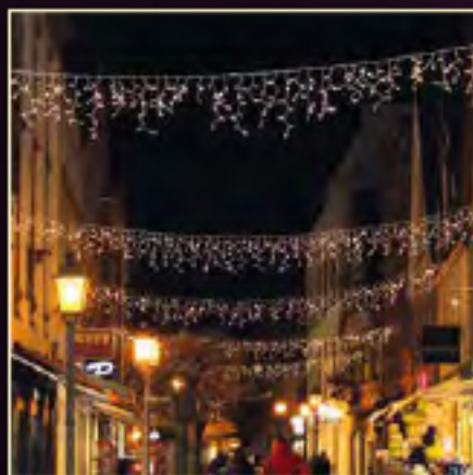
„Eiszapfen“ in Kettenform

Lichterketten inkl. Stecker. Alle Lichterketten sind koppelbar. Beim Koppeln auf die Pfeilrichtung an den Verschraubungen achten!