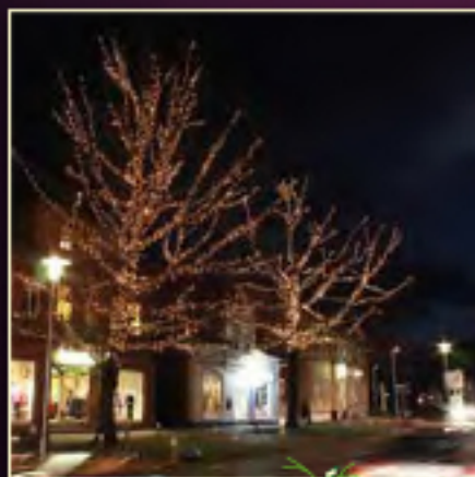
Beispiel: Äste umwickelt