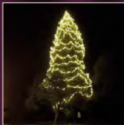
Beispiel: Als Abhänger oder zum Umwickeln

20,0 m Gesamtlänge mit 200 LEDs, teilbar in 5 Abschnitte à 4,00 m